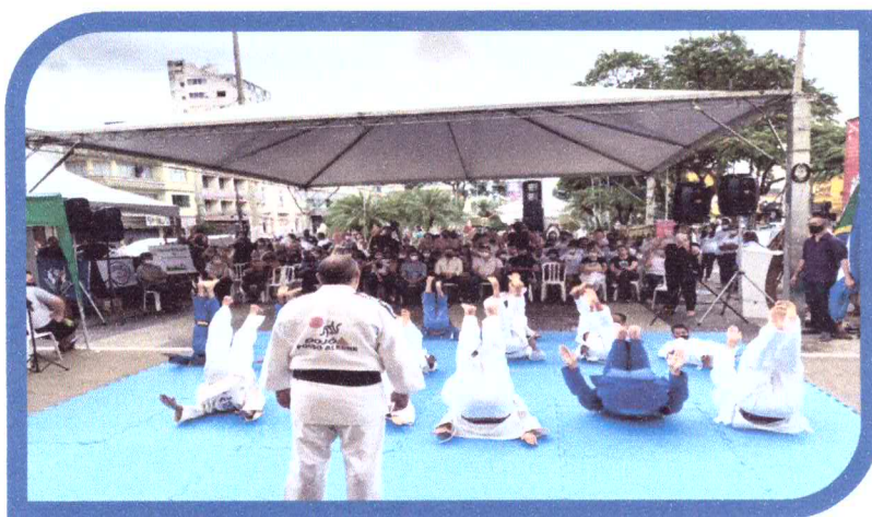
Oficinas de Judô e dança