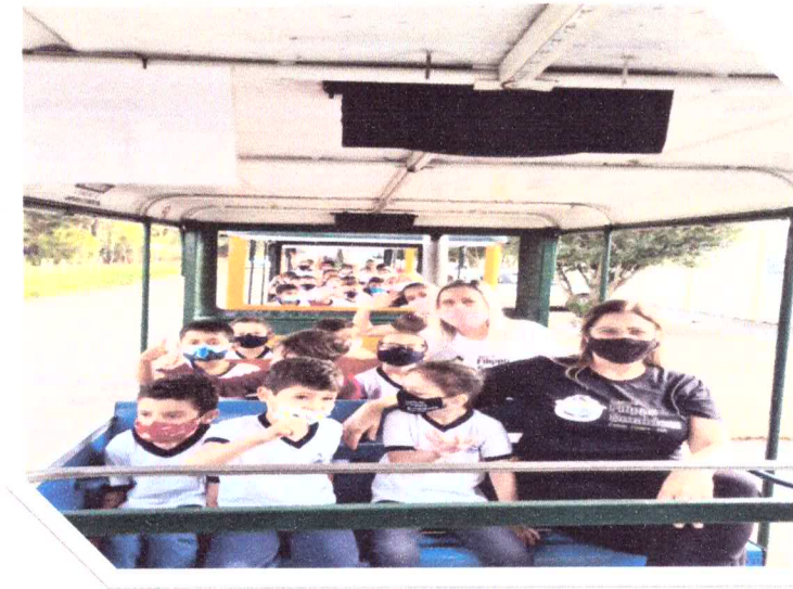
Eventos fora da escola