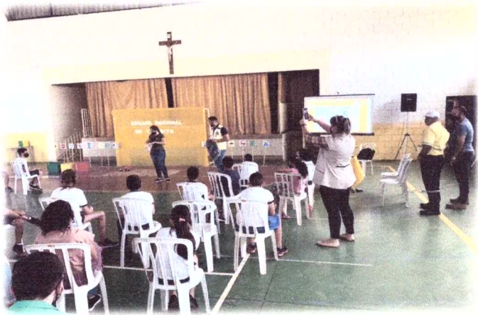
Parceria com o Setor de Trânsito