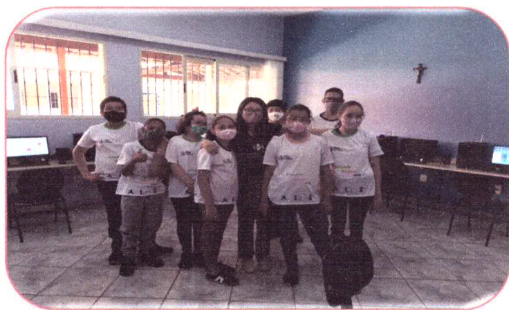
Oficina de informática