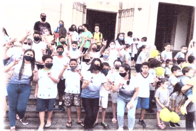
Semana de Educação para a Vida