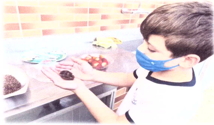
Oficina de Fonoaudiologia