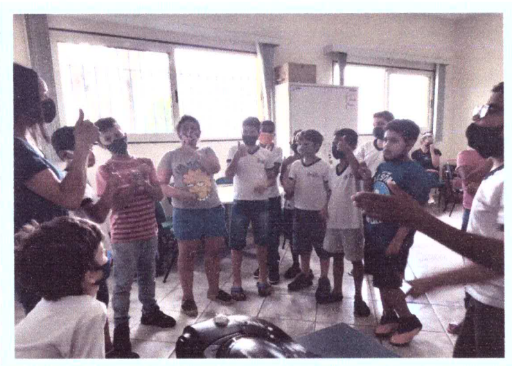
Período Integral-Apoio pedagógico